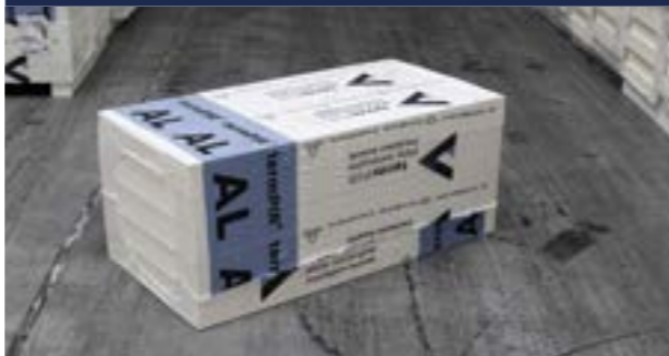
Zdjęcie_02_Paczka 600x1200 (mały format)