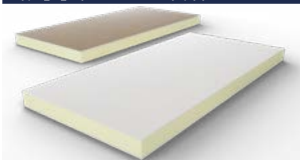
Zdjęcie_06_Przykłdowa wizualizacja płyty (AL GK)