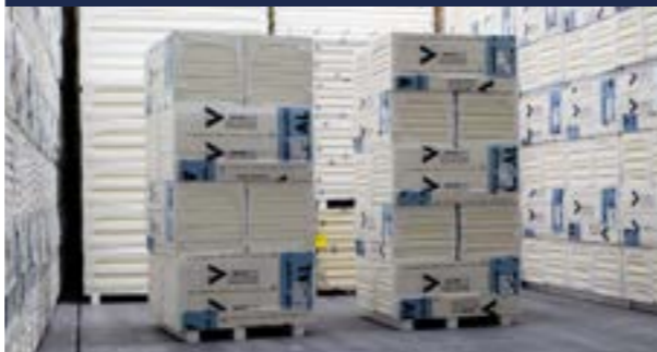
Zdjęcie_04_Stos płyty w małym formacie