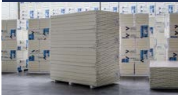
Zdjęcie_05_Stos płyty w dużym formacie