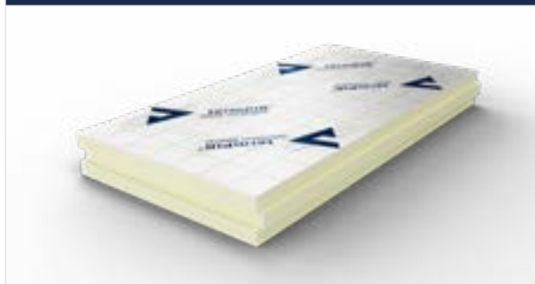
Zdjęcie_01_Przykłdowa wizualizacja jednej płyty