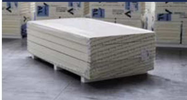
Zdjęcie_03_Paczka 1200x2400 (duży format)