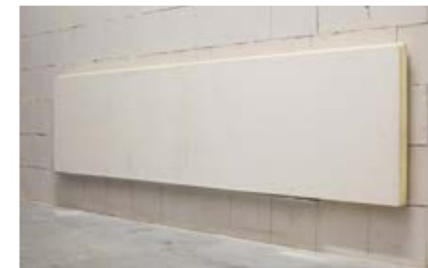
Zdjęcie nr 6. Widok na ustawione płyty.