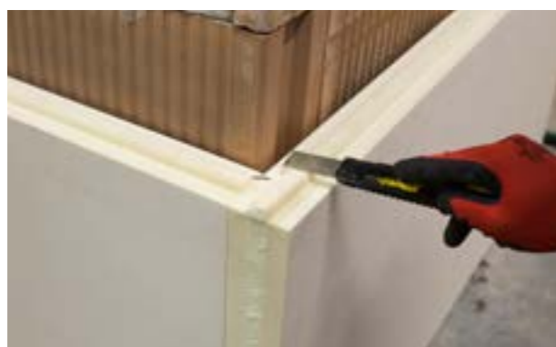
d) Usunięcie pióra płyty narożnej.