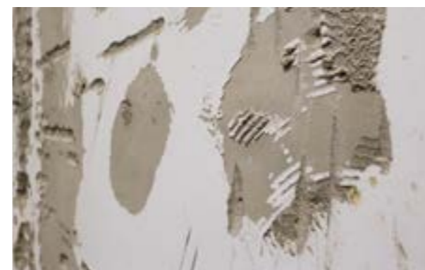
Zdjęcie nr 3. Złuszczające się farby.