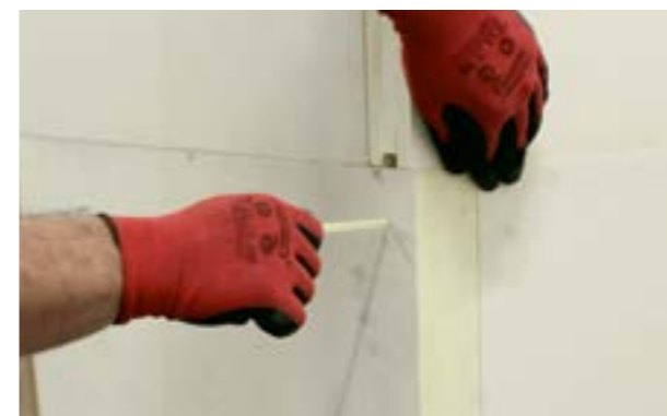
e) Instalacja łączników tworzywowych zabezpieczających narożnik przed deformacją.