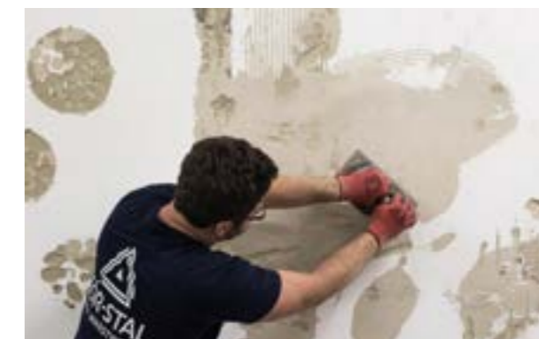
Etap I. Mechaniczne usunięcie pozostałości starych tynków i klei oraz złuszczającej się farby.