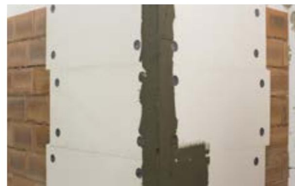
Etap V d) Ułożenie warstwy kleju na ścianie.

Kolejnym zadaniem jest ułożenie siatki na całej ścianie z zalecanym 10-cio centymetrowym zakładem. W związku z dużą powierzchnią, niż miało to miejsce wcześniej, należy zwrócić uwagę na czas urabialności kleju. Przygotowaną ilość kleju należy wykorzystać w czasie nie dłuższym niż wskazuje to producent.