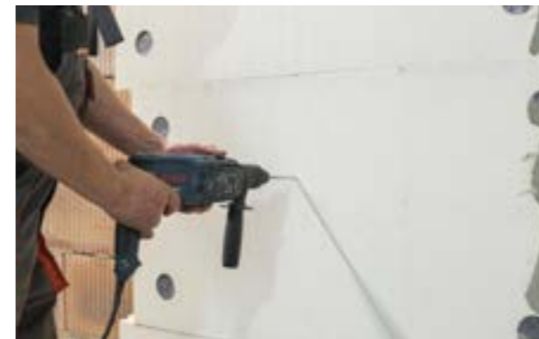
Etap IV a) Przygotowanie otworu w ścianie pod koszulkę kołka.

Do alternatywnego montażu kołków można użyć dedykowanego narzędzia służącego do zagłębienia ich w warstwie termoizolacji.