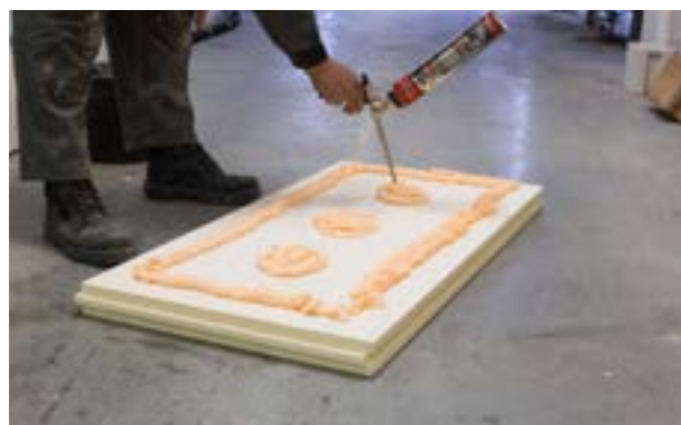
Zdjęcie nr 8. Ułożenie kleju poliuretanowego na płycie.

Alternatywnie do klejenia płyt można użyć kleju poliuretanowego przy zachowaniu wyżej opisanych zasad.