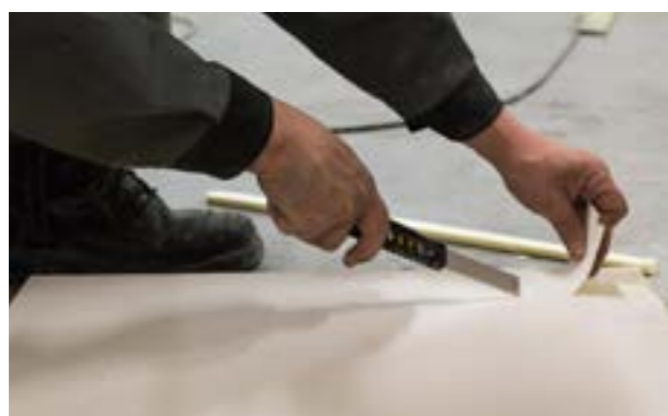
b) Usunięcie okładziny z części płyty łączącej się z czołem poprzecznej.