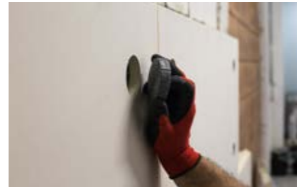
Etap IV e) Montaż zatyczki.