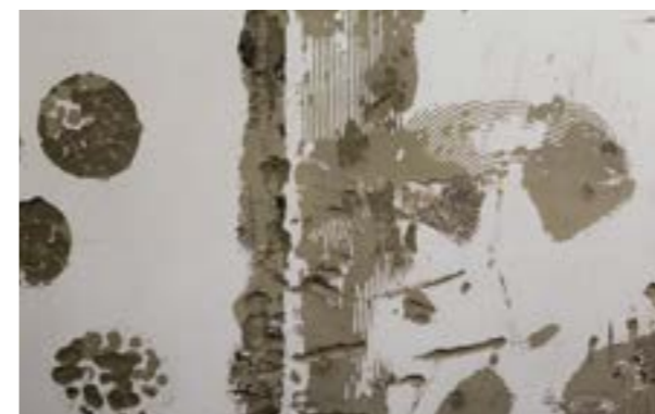
Zdjęcie nr 1. Ubytki do wypełnienia klejem.

Poniżej kilka najczęściej spotykanych defektów podłoża, które należy usunąć przed przystąpieniem do montażu płyt termPIR® ETX.