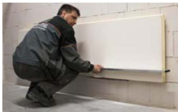
Etap II. c) Montaż i ustawienie kolejnych płyt w pierwszym rzędzie.