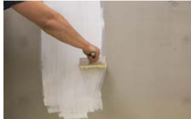
Etap VI a) Gruntowanie warstwy zbrojonej.

Malowanie elewacji w systemie ociepleń termPIR® nie jest obligatoryjne. Malowanie jest szczególnie polecane w celu odnawiania zabrudzonej powierzchni. Częstym rozwiązaniem jest również wykonanie warstwy wierzchniej elewacji za pomocą tynku mineralno-polimerowego Termo Organika® TO-TM i pomalowanie go. Odpowiedni kolor elewacji można uzyskać zarówno wykonując tynk cienkowarstwowy zabarwiony na potrzebny kolor, jak i malując tynk biały farbą w potrzebnym kolorze. Malowanie można rozpocząć po: ok. 3 dniach - tynki cienkowarstwowe, jeżeli temperatura podczas aplikacji i wysychania tynku wynosi co najmniej +15°C, ok. 7-14 dniach - tynki cienkowarstwowe, jeżeli temperatura podczas aplikacji i wysychania tynku wynosi mniej niż +15°C (im niższa temperatura podczas aplikacji i wysychania tynku, tym okres ten powinien być dłuższy), ok. 14 dniach - tynki cementowe i cementowo-wapienne, ok. 28 dniach - beton z zachowaniem zasad malowania podanych przez producenta.