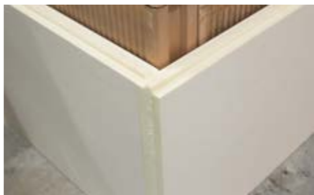
Zdjęcie nr 11. Widok zamontowanych płyt narożnych.