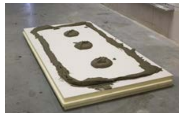
Etap II. a) Ułożenie kleju na płycie.

Płyty termPIR® ETX należy przyklejać do ściany lekko je dociskając celem ustawienia w pionie.