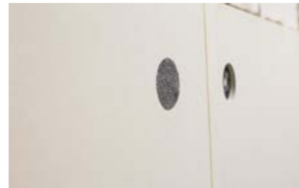
Zdjęcie nr 15. Widok zainstalowanej zatyczki.

Do alternatywnego montażu kołków można użyć dedykowanego narzędzia służącego do zagłębienia ich w warstwie termoizolacji.