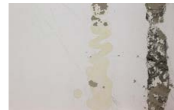
Zdjęcie nr 4. Plamy mogące zmniejszyć przyczepność kleju.