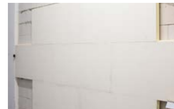
Zdjęcie nr 10. Widok na kolejne rzędy ustawionych płyt.

Uwaga: Płyty muszą licować się względem siebie. Nie ma możliwości późniejszej korekty klawiszujących krawędzi płyt.