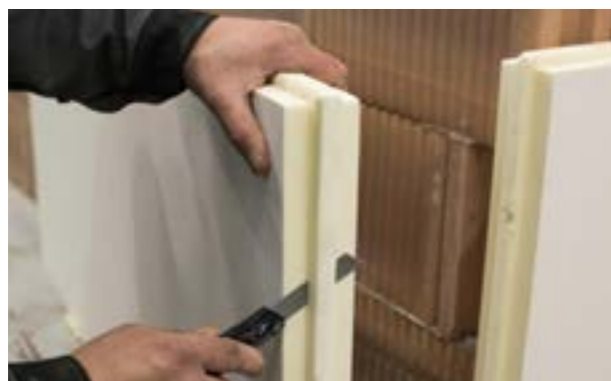
a) Ścięcie pióra zamka.