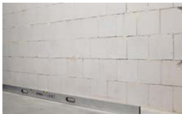
Etap I. a) Wyznaczenie położenia listwy startowej.

Pierwszym etapem jest montaż listwy startowej, która ułatwi późniejszy montaż płyt. Listwę należy zamontować na wcześniej wyznaczonej wysokości w poziomie. Montaż odbywa się za pomocą kołków szybkiego montażu co około 50 cm. Łączenie listwy w narożnikach należy wykonywać wzdłuż dwusiecznej kąta, który tworzą ściany.