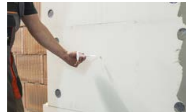
Etap IV b) Osadzenie kołka.