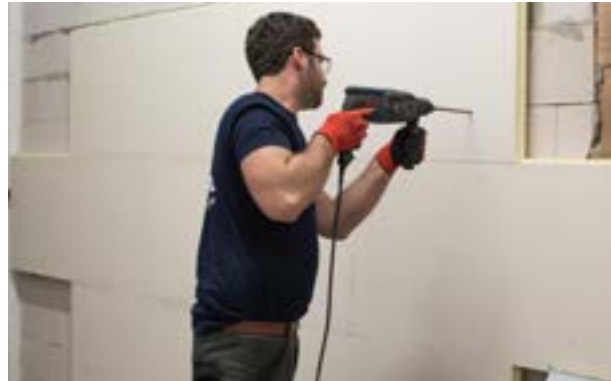
Etap IV a) Przygotowanie otworu w ścianie pod koszulkę kołka.

W celu uniknięcia powstania mostków termicznych i tzw. „efektu biedronki” koszulki kołków należy odpowiednio zagłębić w płycie termPIR® ETX i zakryć je zatyczkami wyciętymi ze styropianu (gotowe w sprzedaży) lub z płyty termPIR®.