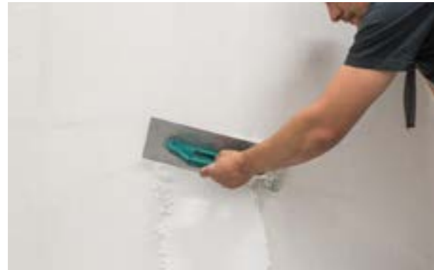
Etap VI b) Układanie warstwy wykończeniowej.