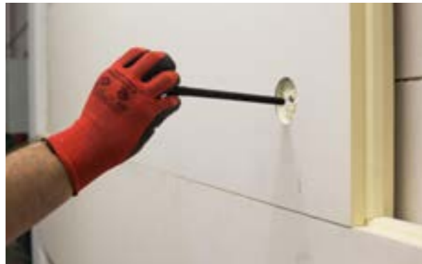
Etap IV c) Montaż koszulki kołka.