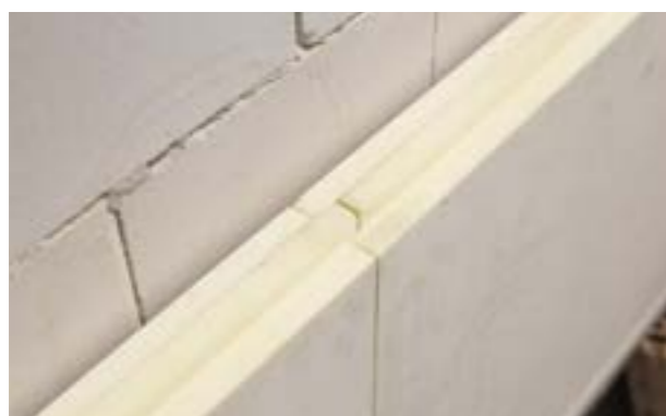
Zdjęcie nr 7. Widok na prawidłowo ustawiony zamek.

Uwaga: Płyty muszą licować się względem siebie. Nie ma możliwości późniejszej korekty klawiszujących krawędzi płyt.