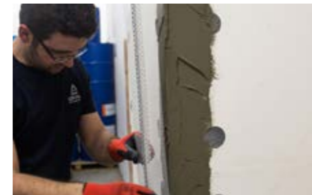
Etap V c) Montaż narożnika gotowego.