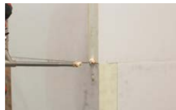
f) Wypełnienie wpustów niskoprężną pianą poliuretanową.

Uwaga: Narożniki należy zabezpieczać przed deformacją sukcesywnie w miarę układania kolejnych warstw płyt.