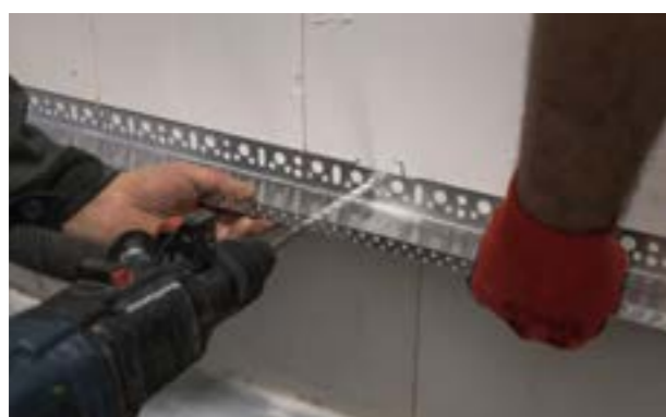
Etap I. b) Ustawienie i montaż listwy startowej.