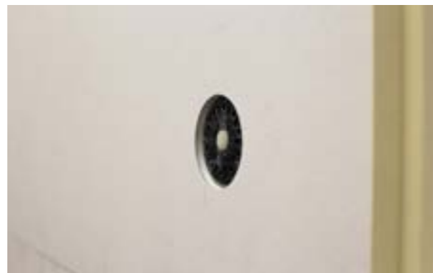
Zdjęcie nr 14. Widok zainstalowanego kołka.