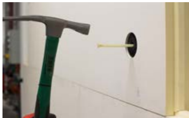
Etap IV d) Montaż trzpienia kołka.