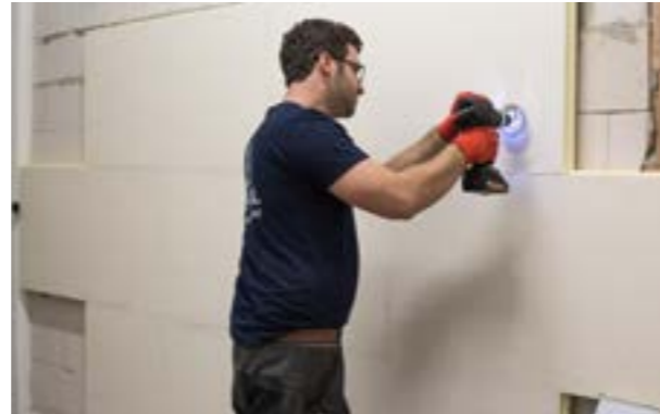
Etap IV b) Wykonanie zagłębienia w płycie pod koszulkę kołka.