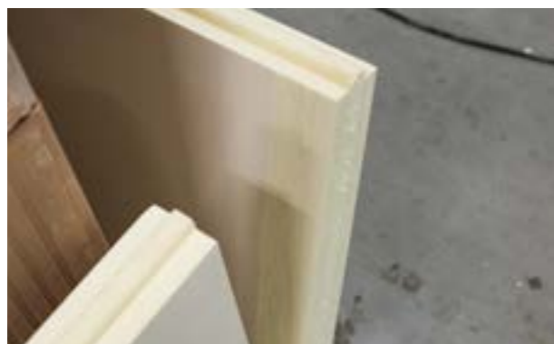
c) Montaż płyt narożnych.