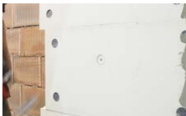
Zdjęcie nr. 16. Widok zagłębionego kołka.