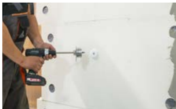
Etap IV c) Zagłębienie kołka w warstwie termoizolacyjnej.