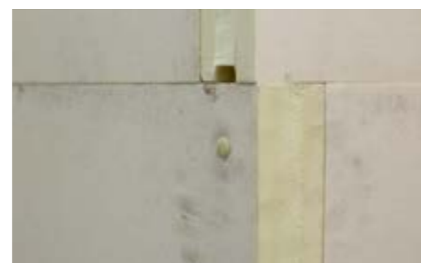
Zdjęcie nr 13. Widok zainstalowanego elementu zabezpieczającego narożnik.

Uwaga: Narożniki należy zabezpieczać przed deformacją sukcesywnie w miarę układania kolejnych warstw płyt.