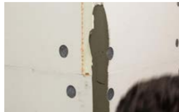
Etap V b) Ułożenie warstwy kleju w narożniku.

Przyklejanie siatki zbrojącej należy rozpocząć nie wcześniej niż po dwóch dniach od przyklejenia płyt termPIR®. Zaleca się rozpoczęcie montażu siatki od narożników, które to należy najpierw pokryć warstwą kleju uniwersalnego Termo Organika® TO-KU lub białym klejem uniwersalnym Termo Organika® TO-KU, a potem zatopić w nim siatkę. Ułożona siatka powinna być napięta. Klej należy układać za pomocą kielni i pacy gładkiej. Dla ułatwienia pracy można zastosować narożniki gotowe odpowiednio ukształtowane na etapie produkcji.