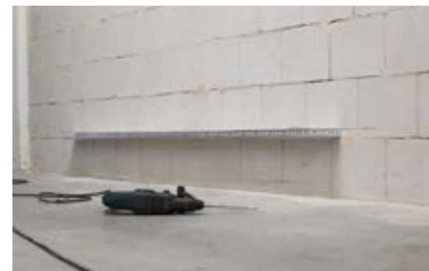
Zdjęcie nr 5. Prawidłowo zamontowana listwa startowa.