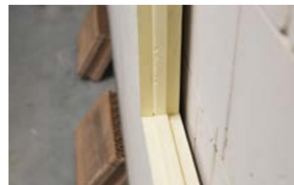
Zdjęcie nr 9. Widok na prawidłowo ustawiony zamek.