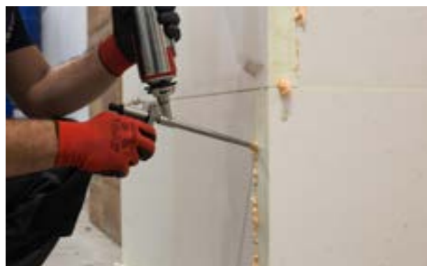
Etap V a) Wypełnienie szczelin niskoprężną pianą poliuretanową.

Przed przystąpieniem do montażu siatki, szczeliny między płytami o szerokości 3 mm i większe należy wypełnić niskoprężną pianą poliuretanową.