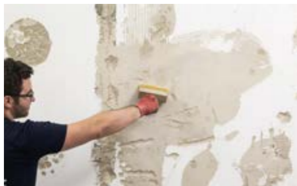
Etap II. Odpylenie podłoża.