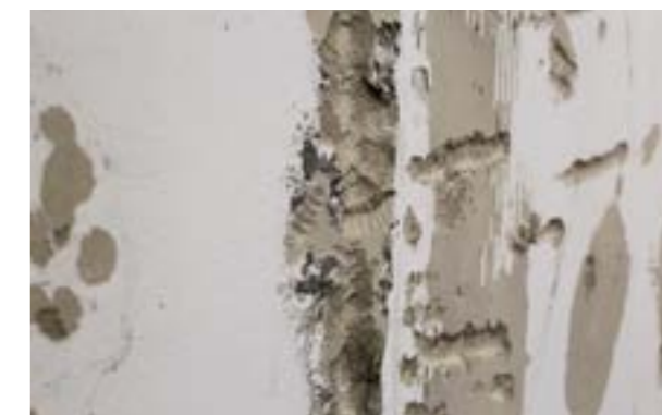
Zdjęcie nr 2. Pozostałości po poprzednich warstwach wykończeniowych.