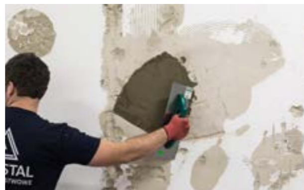
Etap III. Wykonanie warstwy wyrównującej na wcześniej przygotowanym podłożu.