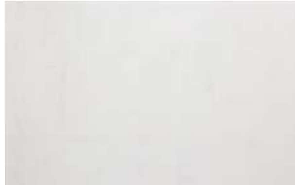
Zdjęcie nr 17. Widok zagruntowanej warstwy zbrojonej.