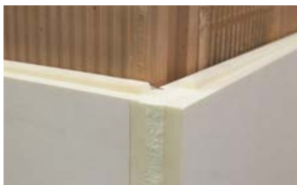
Zdjęcie nr 12. Widok płyt przygotowanych do montażu kolejnego rzędu.