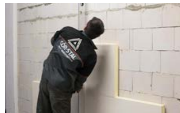
Etap III. a) Montaż i ustawienie drugiego rzędu płyt.

Kolejne przyklejane rzędy paneli montuje się analogicznie jak pierwszy pamiętając, że powinny być one przesunięte względem poprzednich tak, żeby pionowe połączenia płyt zachowały układ mijankowy.